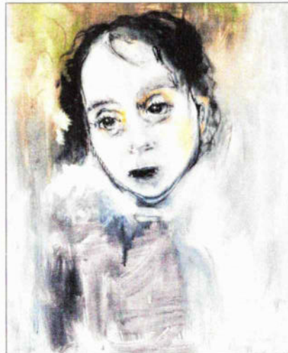
Manon Heupels Gemälde „und sie legten den Blumen Handschellen an“.